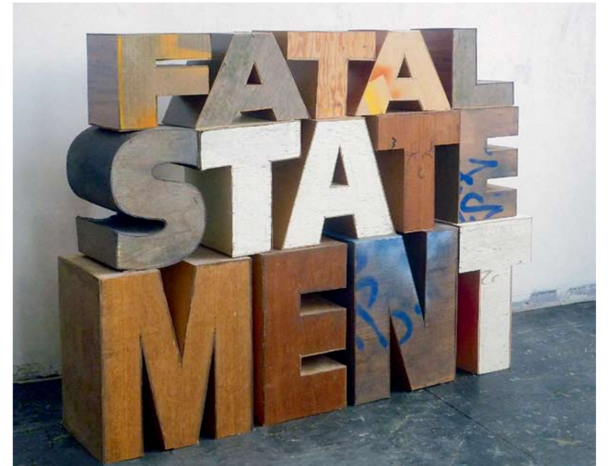
Irène Huga. Fatāls apgalvojums. Koks / Irène Hug. Fatal statement . Wood 2010