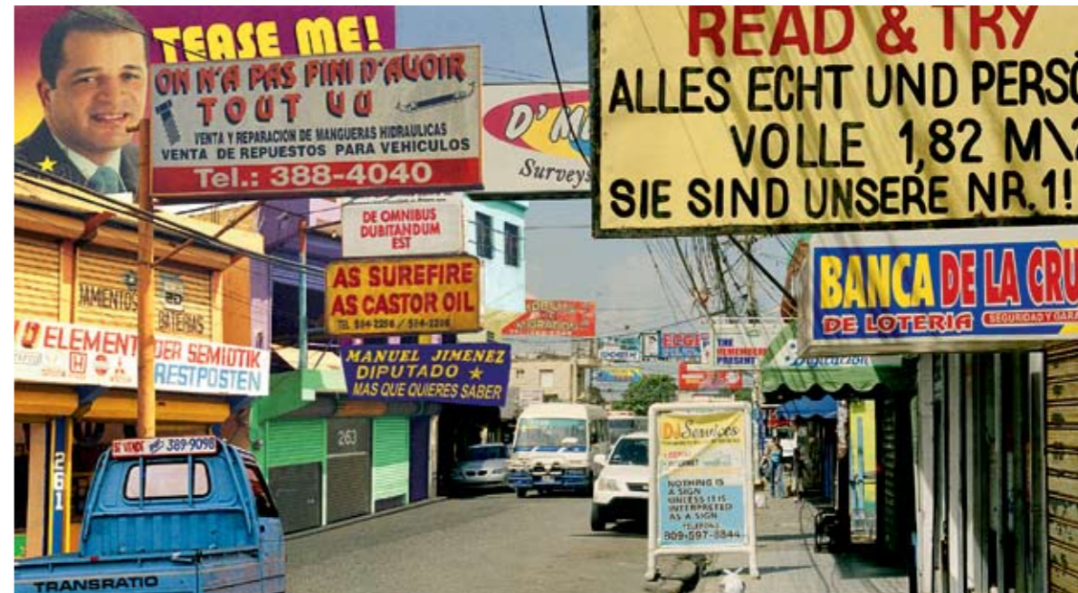
Irène Huga. Lasi un mēģini. Digitāldrūka / Irène Hug. Read & Try . Digital print 108x200 cm. 2007

I.H.: I don't expect anything from the viewer – they themselves know how they want to behave. However, the more keenly they look, the more they can uncover and experience, the more insights they will gain. The more the viewer submits, the more they will get back in return. I hope that the interrelationships of meanings in my works are understandable to all viewers, but it is also clear that there is not just one way of seeing. Everybody reads my texts differently, so therefore the