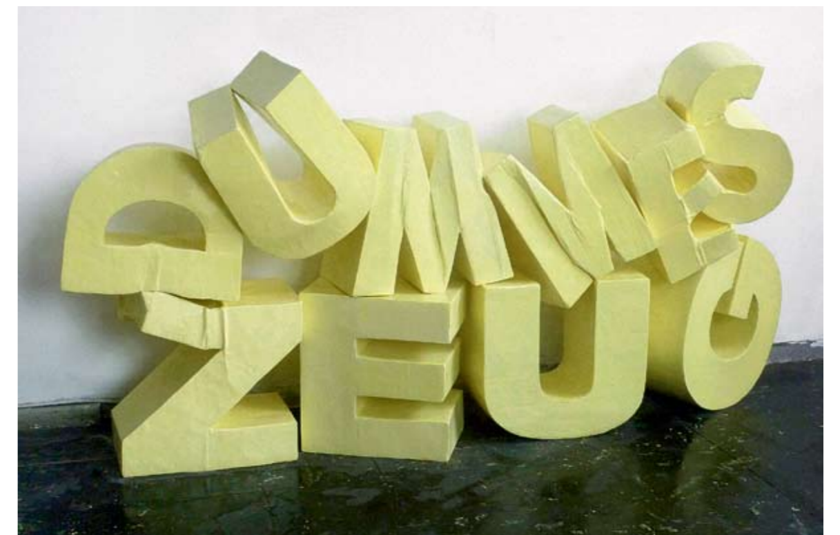
Irène Huga. Muļķīgas lietas. Kartons, ģipsis, laka / Irène Hug. Silly Things . Cardboard, plaster, laquer 102x184x56 cm. 2009

(59-63) Foto no publicitātes materiāliem / Publicity photos