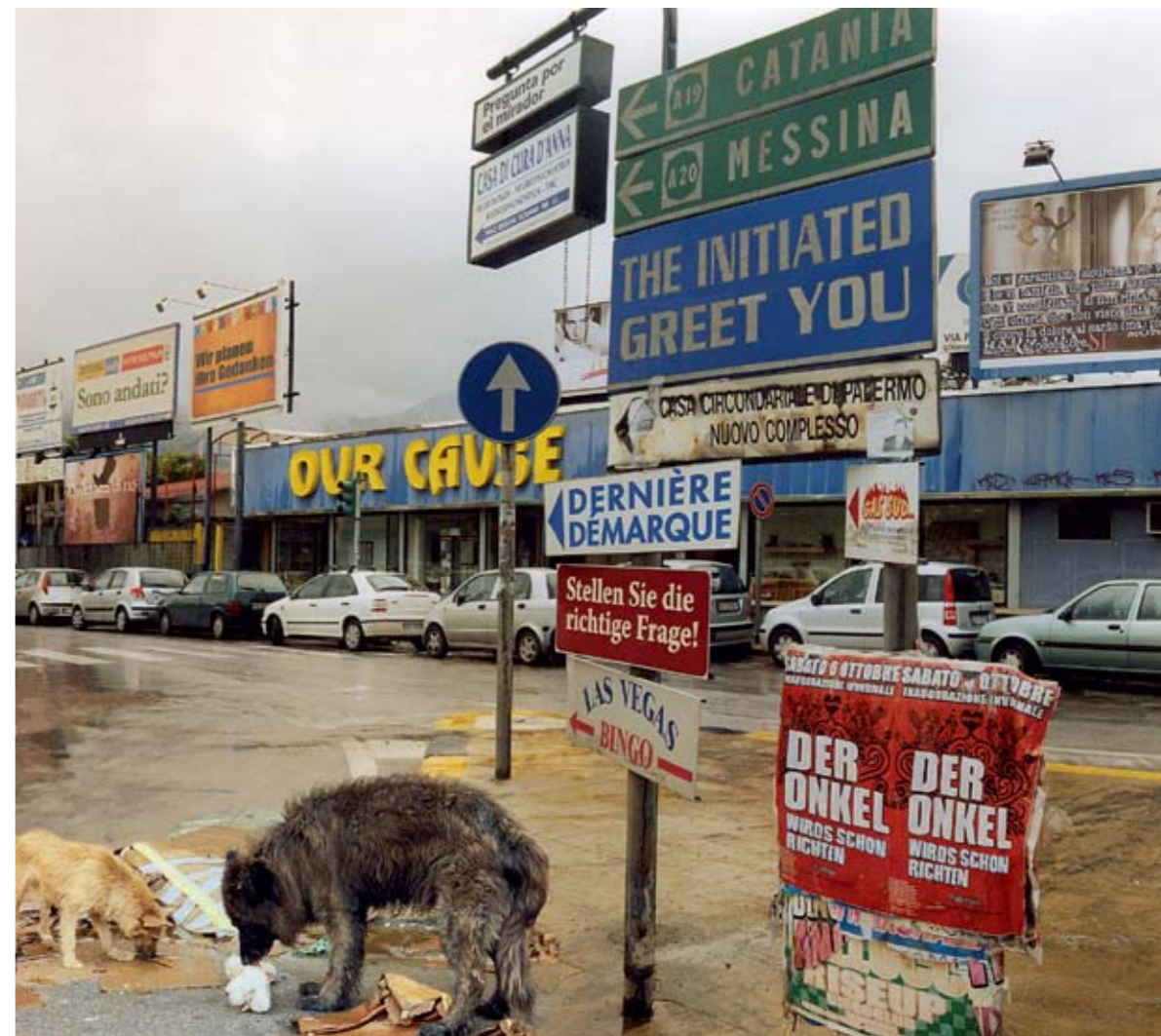
Irène Huga. Cosa Nostra (Mūsu lieta). Digitāldrūka / Irène Hug. Cosa Nostra ( Our Cause ). Digital print 156x175 cm. 2010